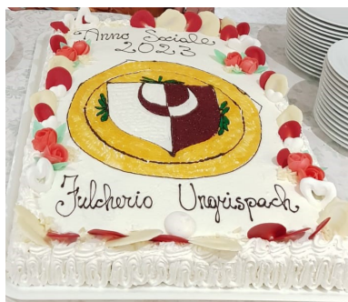
Momenti piacevoli della cena sociale e la nostra bellissima e buonissima torta